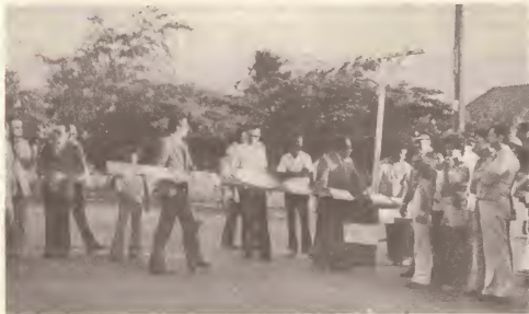
Reconstrucion di caretera na Savaneta ta keda cla.

Nunca antes tanto carreteranan a worde recap na Aruba den un periodo di 3 aña y mei. Encontrando e carreteranan di Aruba den un situacion deplorable, Gobierno Insular a institui un programa di recapmento den corto tempo y te cu fin di 1978 un total di 59 km di carretera a worde recap. Otro carreteranan a worde totalmente reconstrui manera esunnan di Kibaima-Tanki Flip, Paradera y Santa Cruz. Ademá, considerando e aumento di cantidad di autonon na Aruba, gobierno a laga construi carreteranan nobo tambe manera esun di Verbindingsweg pa La Sallestraat y e parti dobbel di L.G. Smith Boulevard. Tur esakinan ta parti di un masterplan di carreteranan cual ta encerra construcion di mas carreteranan, incluyendo un carretera dobbel di Playa pa San Nicolas.